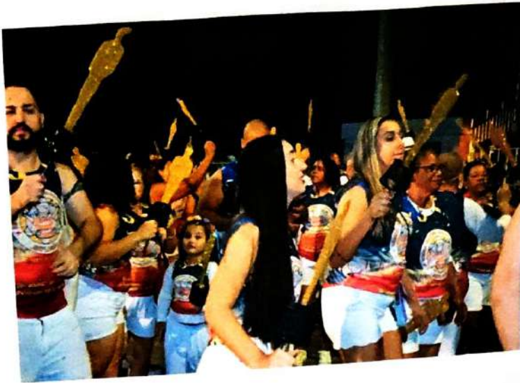
25 de Abril de 2024