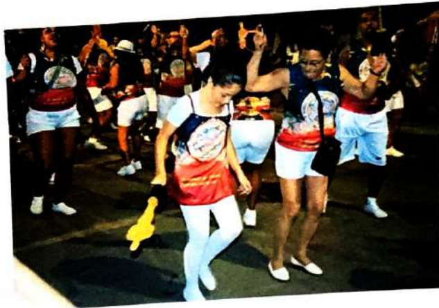
25 de Abril de 2024