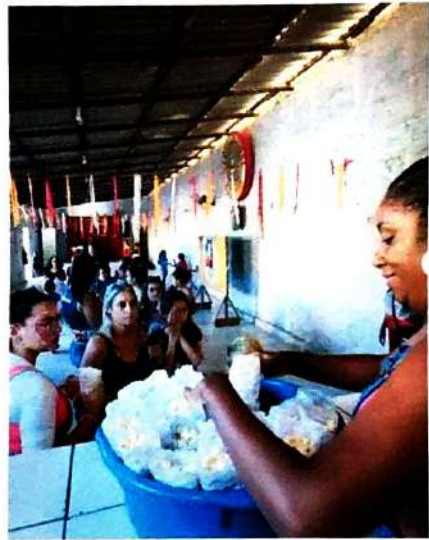
12 de Março de 2024