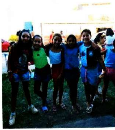
12 de Março de 2024