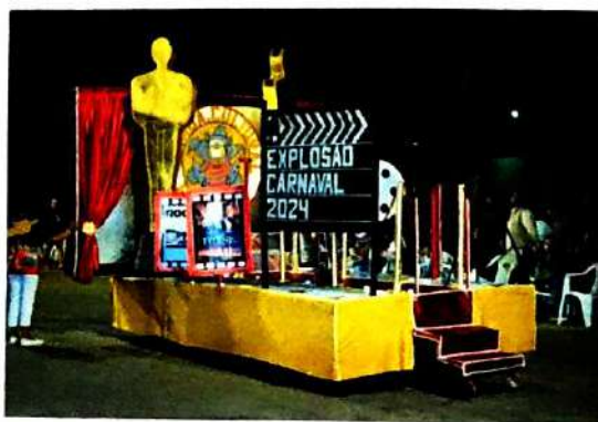
25 de Abril de 2024