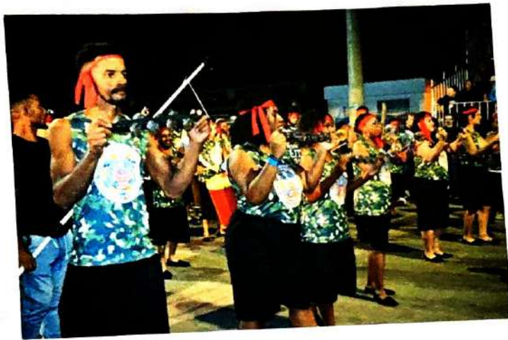
25 de Abril de 2024