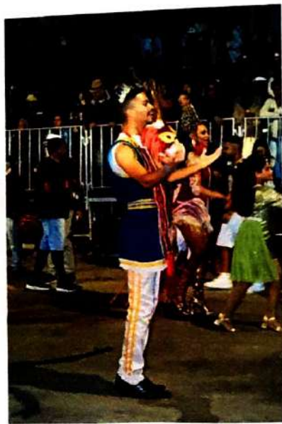
25 de Abril de 2024