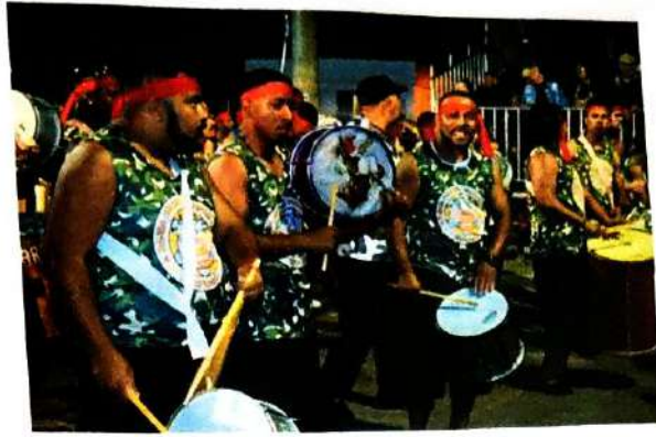
25 de Abril de 2024