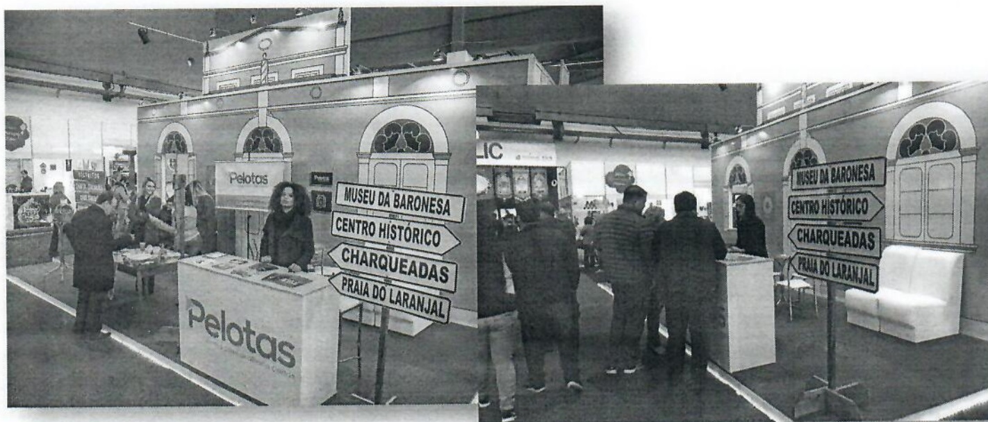
Imagens: Estante institucional no evento